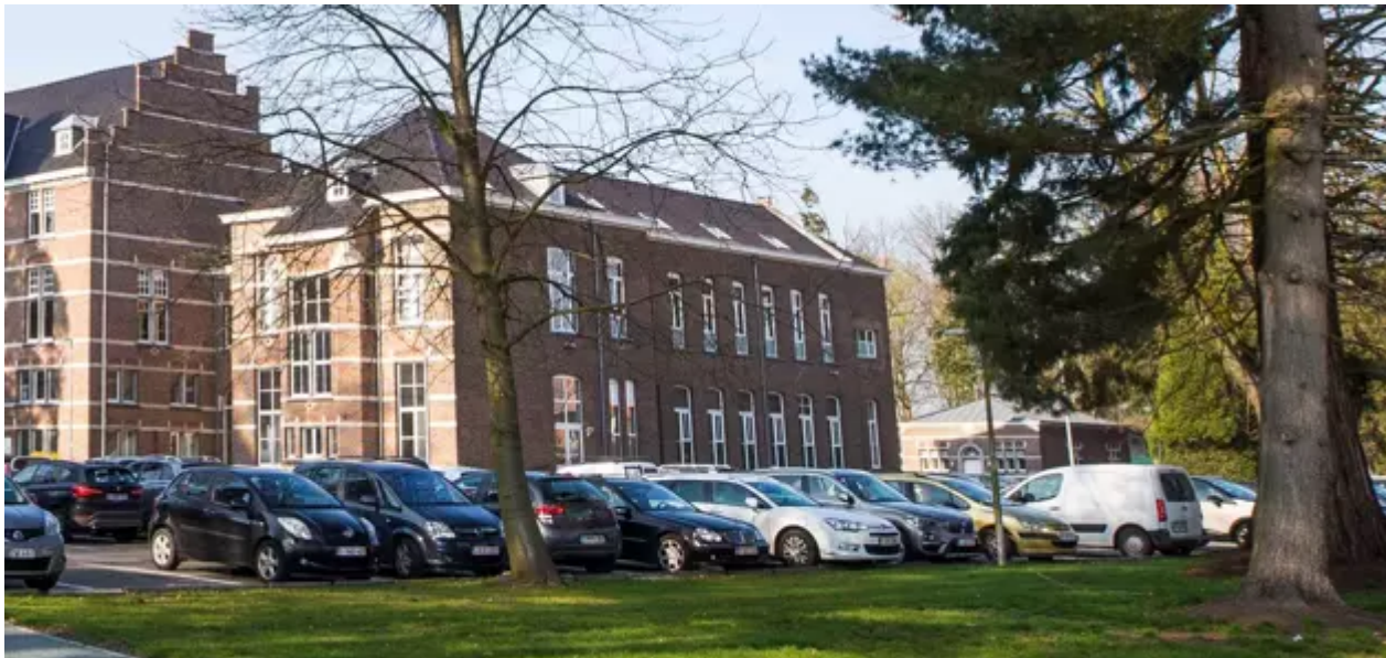
Kapellei 133 , 2980 Zoersel