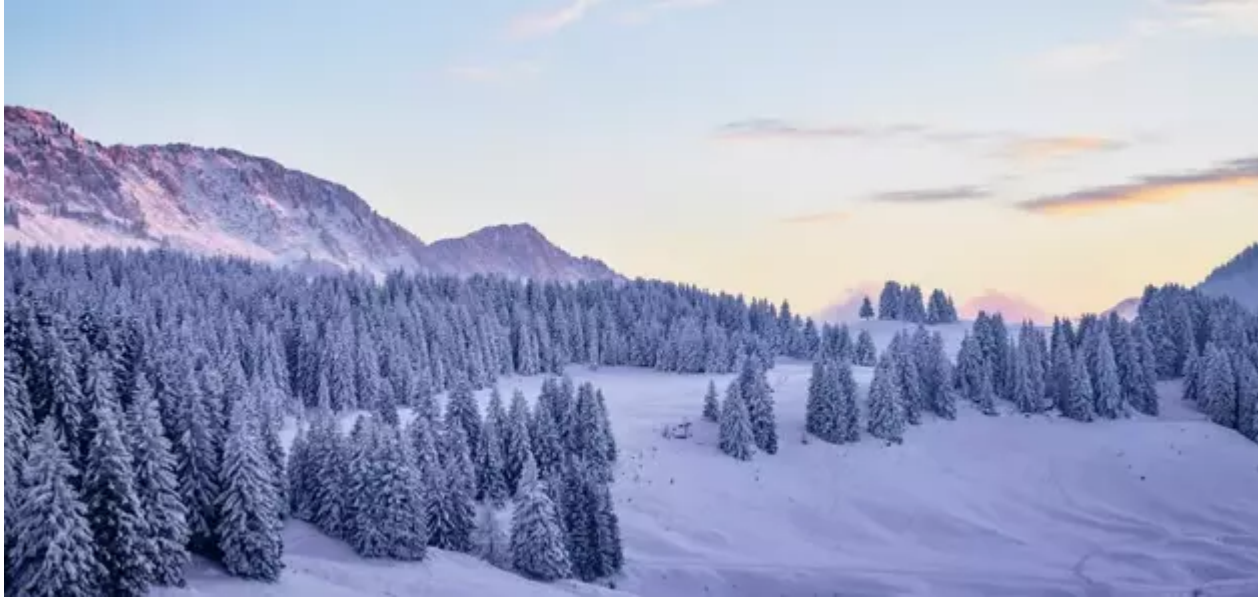
Van Schoonbekestraat 54/2 , 2018 Antwerpen