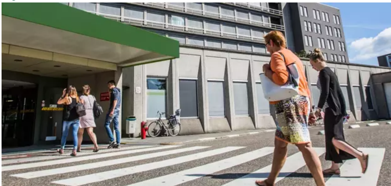
Lange Bremstraat 70 , 2170 Merksem