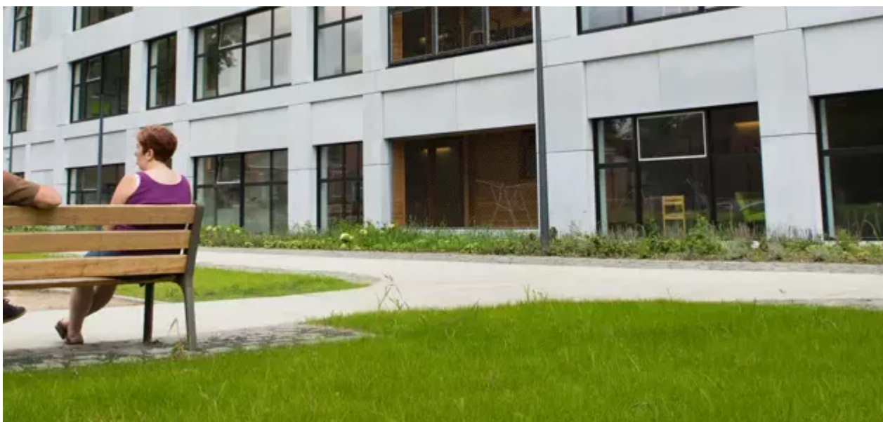
Pothoekstraat 109 , 2060 Antwerpen