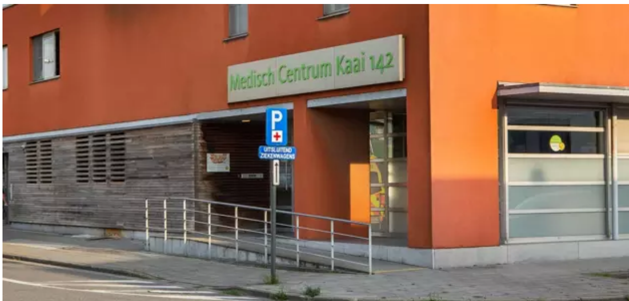
Mullhouselaan Noord 3 , 2030 Antwerpen (Haven)