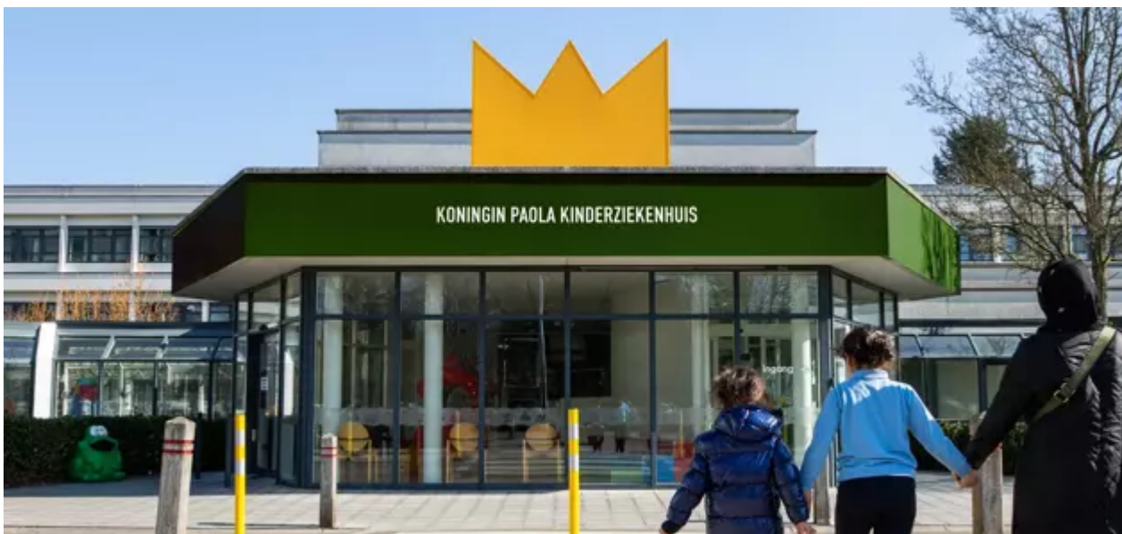
Lindendreef 1 , 2020 Antwerpen