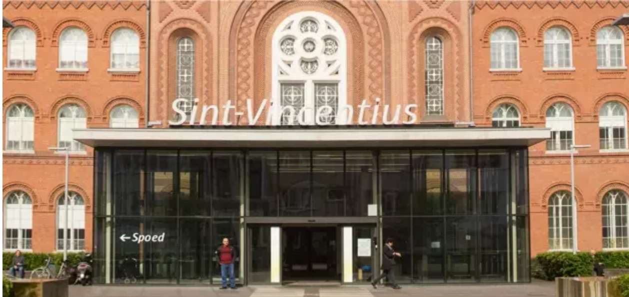
Sint-Vincentiusstraat 20 , 2018 Antwerpen