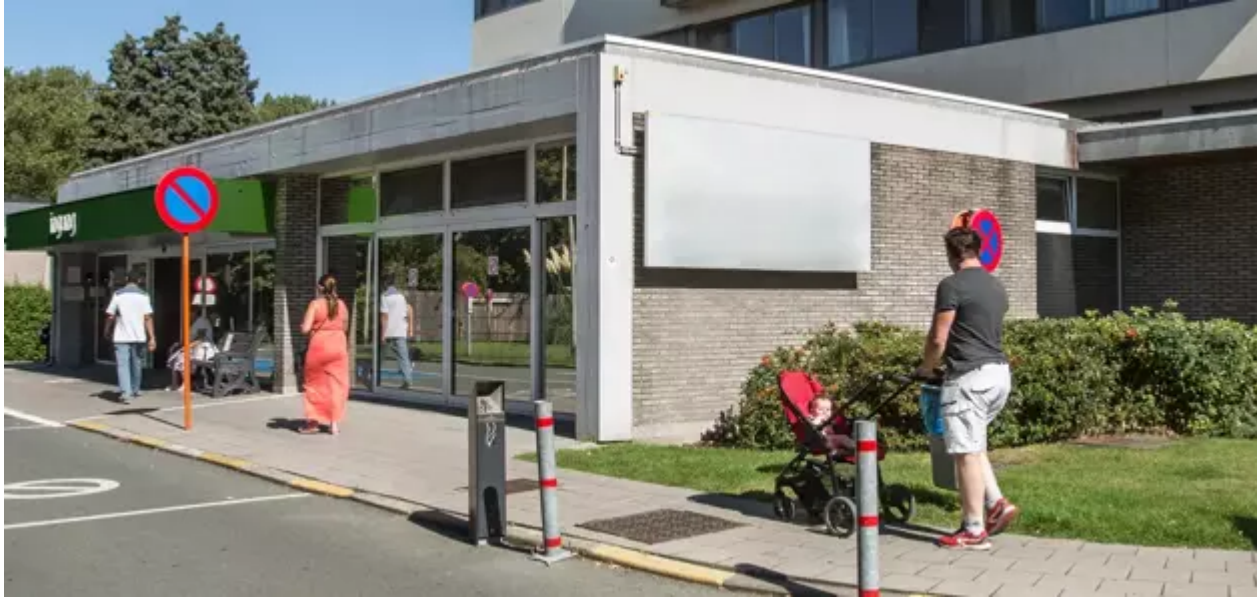
Commandant Weynsstraat 165 , 2660 Hoboken