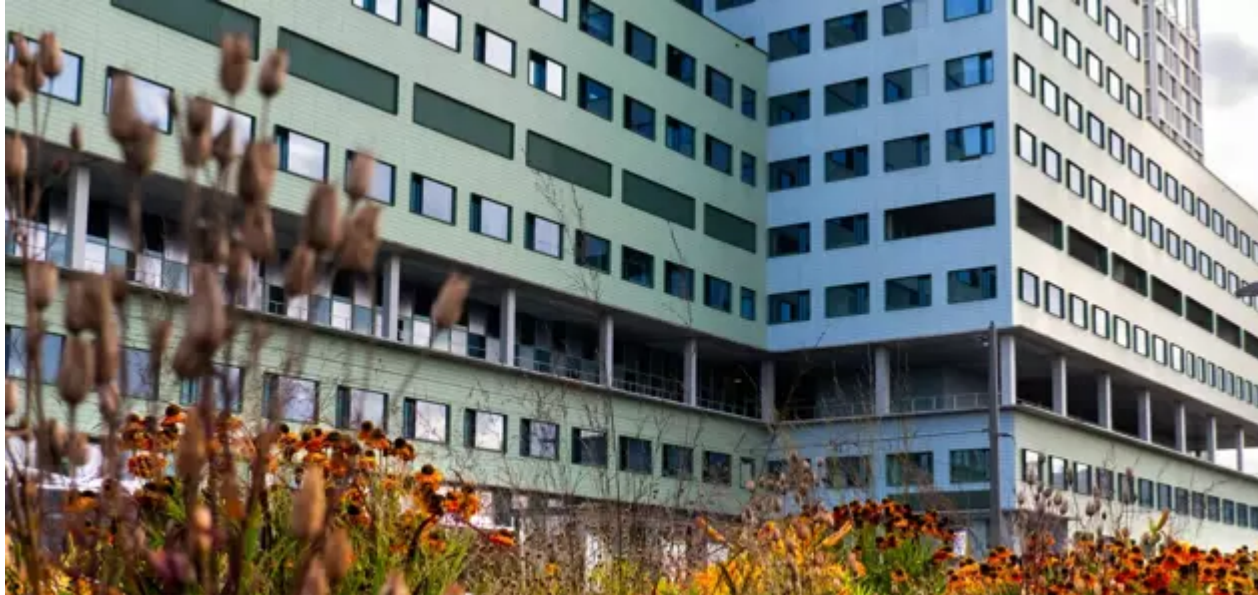
Kempenstraat 100 , 2030 Antwerpen