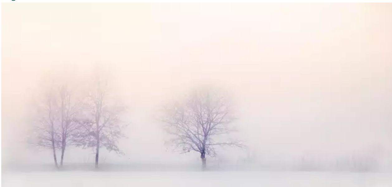
Molenstraat 19 , 2640 Mortsel