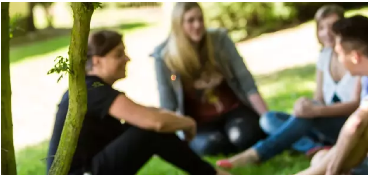
Lindendreef 1 , 2020 Antwerpen